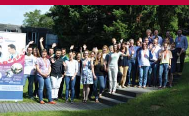
Junge Angiologen bei der Vaskulären Summer School